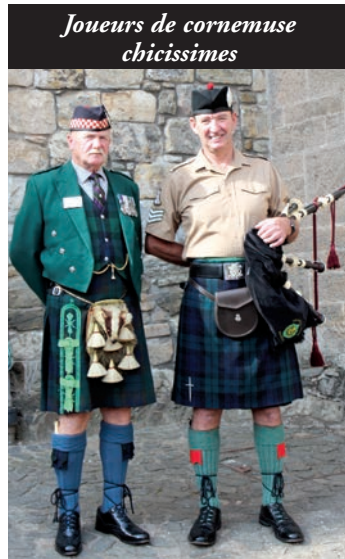
Joueurs de cornemuse chicissimes

contrent). Construction médiévale fortifiée du 13 e siècle, reliée au continent par un pont à marée haute. Entièrement restauré, le château appartient à la famille Mac Rae. Eilean Castle figure dans le film de James Bond : Skyfall. Notre voyage se poursuit le long du canal calédonien, entre Fort William et Inverness, reliant l'océan Atlantique à la mer du Nord. Sur 96 km, le tracé traverse 3 lochs; il a fallu