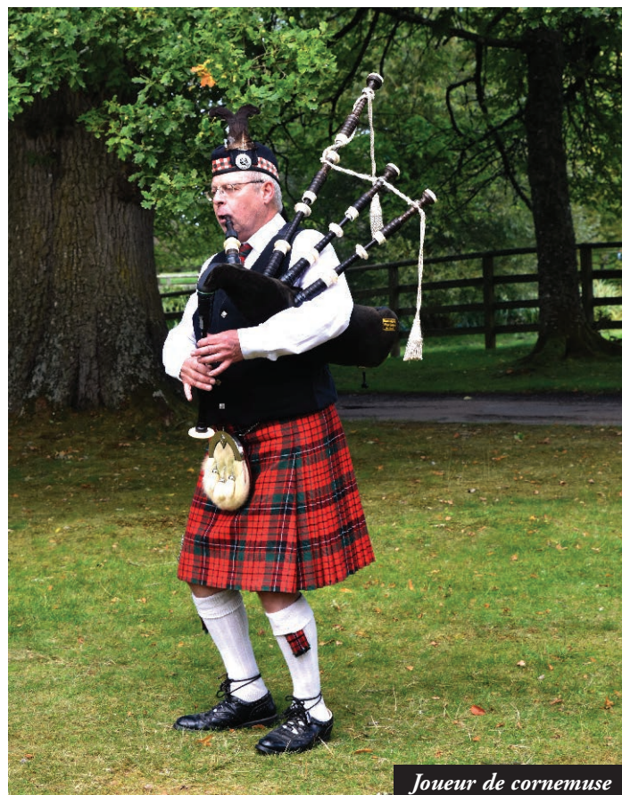
Joueur de cornemuse

éprise de liberté, en rivalité presque continue avec les Anglais, s'est pleinement révélée lors de ce spectacle où les artistes ont mis du cœur à l'ouvrage. Retour à l'hôtel.