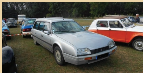
Break série II pare chocs plastique (photo auteur).

Poids 1400 kg, c'est 135 kg de plus que la berline. C'est l'un des plus rapides parmi les breaks spacieux, mais le seul avec une suspension à correction d'assiette automatique qui facilite le chargement. De plus il est capable de « charger comme un utilitaire, 1380 litres et plus de 2 m 3 en rabattant la banquette, la longueur du coffre passant de 1,25 à 2,10 m. Voitures retenues par les brocanteurs (avec la Volvo), les ambulanciers ou ceux qui ont besoin d'une "super-camionnette" joignant le volume au confort et à la vitesse.