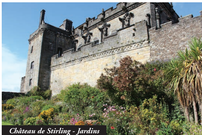
Château de Stirling - Jardins

Nous atteignons ensuite Stirling : haut-lieu d'affrontements entre Écossais et Anglais. L'imposant château forteresse et ses remparts du 14 e et 15 e siècle, fixé sur un éperon volcanique, est un lieu stratégique, porte d'entrée des Highlands. Arrivés dans une cour, un palais jaune ocre, mobilise nos regards : il abrite le Great Hall, la plus grande salle de réception d'Écosse en 1503 pour 500 personnes. Visite des appartements reconstitués du palais royal et de la salle de Stirling Heads dont le plafond est orné de remarquables médaillons en bois sculptés et peints de couleurs vives, représentant des visages de rois, reines, nobles... Le son des tuyaux d'une cornemuse nous attire vers la chapelle royale. Nikodim nous fait observer la richesse de l'architecture : hautes fenêtres en granit couronnées des symboles de l'Écosse : un chardon et une rose. Visages et animaux sculptés et représentations multiples de la licorne, animal masculin de la mythologie celtique, qui exprime le refus de l'abdication de l'Écosse devant l'Angleterre. Pour feuilleter des pages d'histoire déterminantes, il nous entraîne