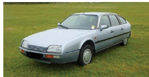
CX TRS série II.

Connue de certains initiés car deux journaux en s'en firent l'écho, les quelques exemplaires qui peuvent encore circuler sont le Graal des connaisseurs (3) . Si vous rencontrez une CX modèle ci-dessus, en couleur Gris Perlé AVEC 6 SPHÈRES, vous ferez peut-être un bon placement si le vendeur n'est pas informé.