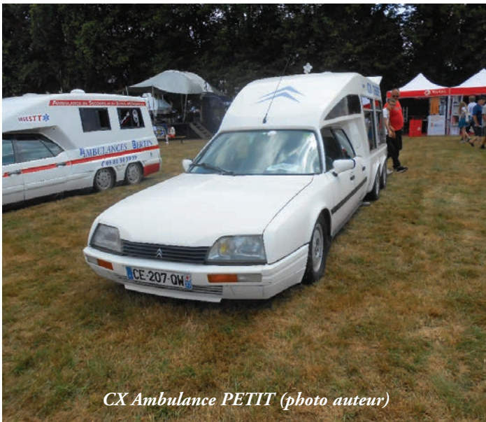
CX Ambulance PETIT