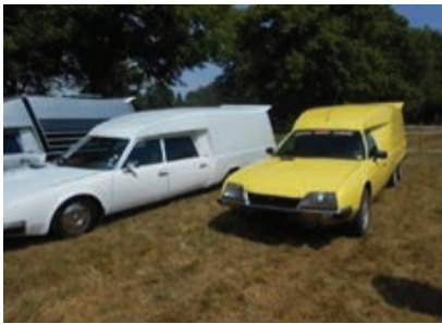
CX TISSIER utilisés chez HOLLANDER.

Les carrossiers suisses Beutler et Caruna ont réalisé des CX à hayon. Mais à quel prix et combien ?