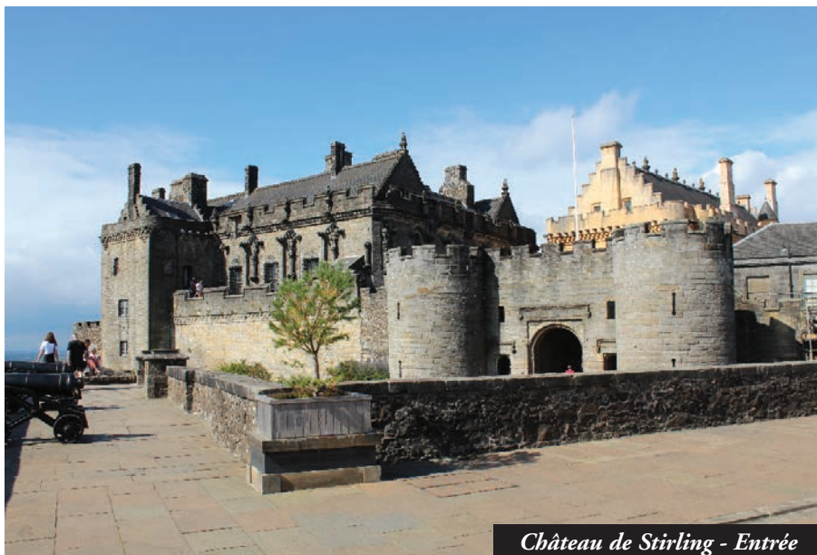
Château de Stirling - Entrée

le gardien de l'Écosse de 1296 à 1306. Pourchassé par les Anglais, il est capturé, trahi par un écossais, livré aux Anglais et mis à mort à Londres, à 35 ans, en 1305, sur ordre du roi, dans d'atroces conditions. « hanged, drawn and quartered ». Sa mort violente et cruelle en fait un martyr, symbole de la lutte pour l'indépendance. Le sentiment national écossais se renforce. Robert the Bruce , roi d'Écosse de 1306 à 1329, remporte en 1314 la bataille de Bannockburn, petit village au sud de Stirling (8000 Écossais contre 20 000 Anglais). La cavalerie anglaise est décimée par des fantassins armés de piques de 3 à 5m à bouts ferrés, répartis sur trois rangs. Victoire écossaise : David contre Goliath. En 1328, le traité d'Édimbourg, signé entre l'Angleterre et l'Écosse, garantit l'indépendance de l'Écosse et la légitimité du roi Robert the Bruce.... Le palais royal de Stirling appartient à la dynastie Stuart. Jacques Stuart, roi d'Écosse depuis 1513, y réside avec son épouse Marie de Guise. Leur fille, Marie Stuart y naît en décembre 1542. L'autorité royale n'est pas reconnue car le pays est divisé :