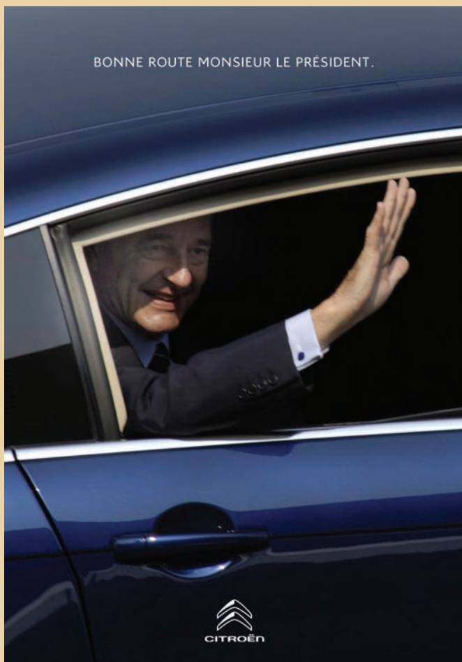
Septembre 2019, Citroën, à l'occasion du décès du Président Chirac, renouvelle un coup médiatique déjà utilisé pour un départ, moins tragique, celui de Mitterrand qui quittait l'Élysée. Paru dans le Figaro Magazine.

Après Jacques Chirac devenu Président de la République, choisira pour ses déplacements privés de rouler en XM V6 24 soupapes, intérieur cuir beige.