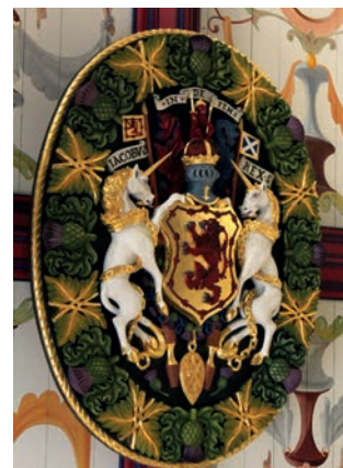
Stirling - Blason Ecossais Chambre du Roi

le train à vapeur dans plusieurs films d'Harry Potter... La grande histoire rejoint l'imaginaire fantastique de la saga de la célèbre écrivaine des cafés d'Édimbourg Joan Kathleen Rowling... Au port de Mallaig, nous prenons la mer sur le Western Isles, sous la pluie pour observer la faune marine : phoques et dauphins communs. La péninsule de Knoydart nous surprend : des maisons de maîtres sont posées au pied d'abruptes falaises, seulement accessibles par voie maritime, d'autres sont perchées et isolées sur les hauteurs, taches blanches dans un écrin de verdure. Le capitaine nous sert le whisky à 10h30 du matin tandis que mouettes, goélands, cormorans, guillemots, sternes et fulmars poussent des cris perçants dans la grisaille d'un ciel de plomb. Notre bus prend le ferry sous une pluie opaque, à destination de l'Île volcanique de Skye, « l'île des nuages » (1700 km 2 , 6000 habitants qui parlent le gaélique). Les paysages sculptés par les siècles et les vents montrent un relief accidenté. L'horizon