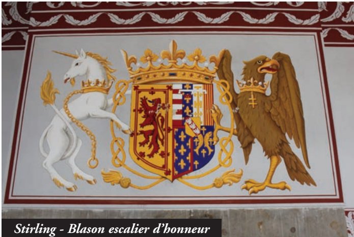
Stirling - Blason escalier d'honneur

bleu du ciel s'installe, créant une atmosphère captivante. Portée arbore ses façades colorées roses, bleues, jaunes. Nous retournons sur le continent en empruntant le Skybridge, pont de 7 arches ouvert en 1995. Après un excellent déjeuner de poisson au restaurant Balmakara, nous repartons pour Eilean Donan Castle (du nom de l'évêque Donan qui, en 600 établit une communauté catholique sur un îlot où 3 lochs se ren-